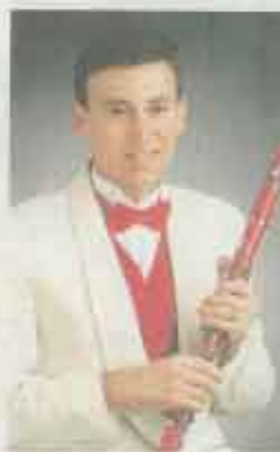
Americký dirigent a klarinetista Carl Topilow přistoupil k Plzeňské filharmonii jako k big bandu.

Ve druhé části večera zněly melodie z amerických muzi-